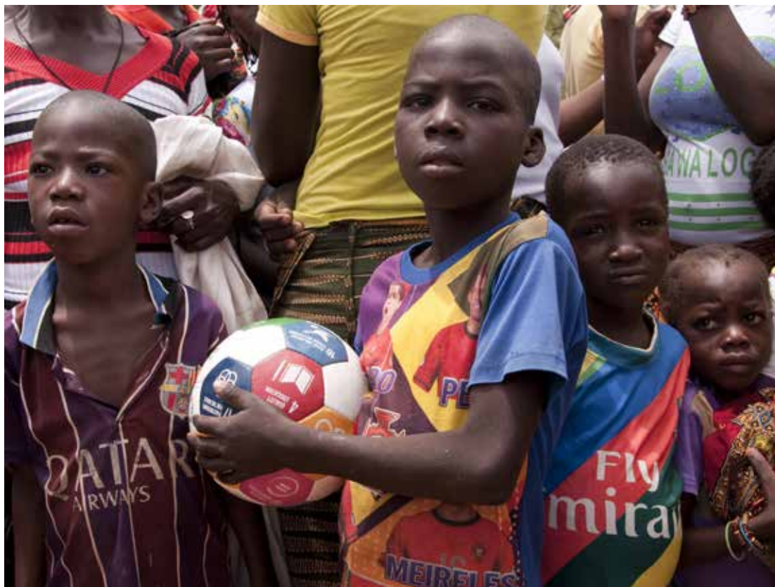
Garçon avec un ballon de foot ODD de conception danoise dans le village de Kamsé, région du Centre-Est du Burkina Faso.