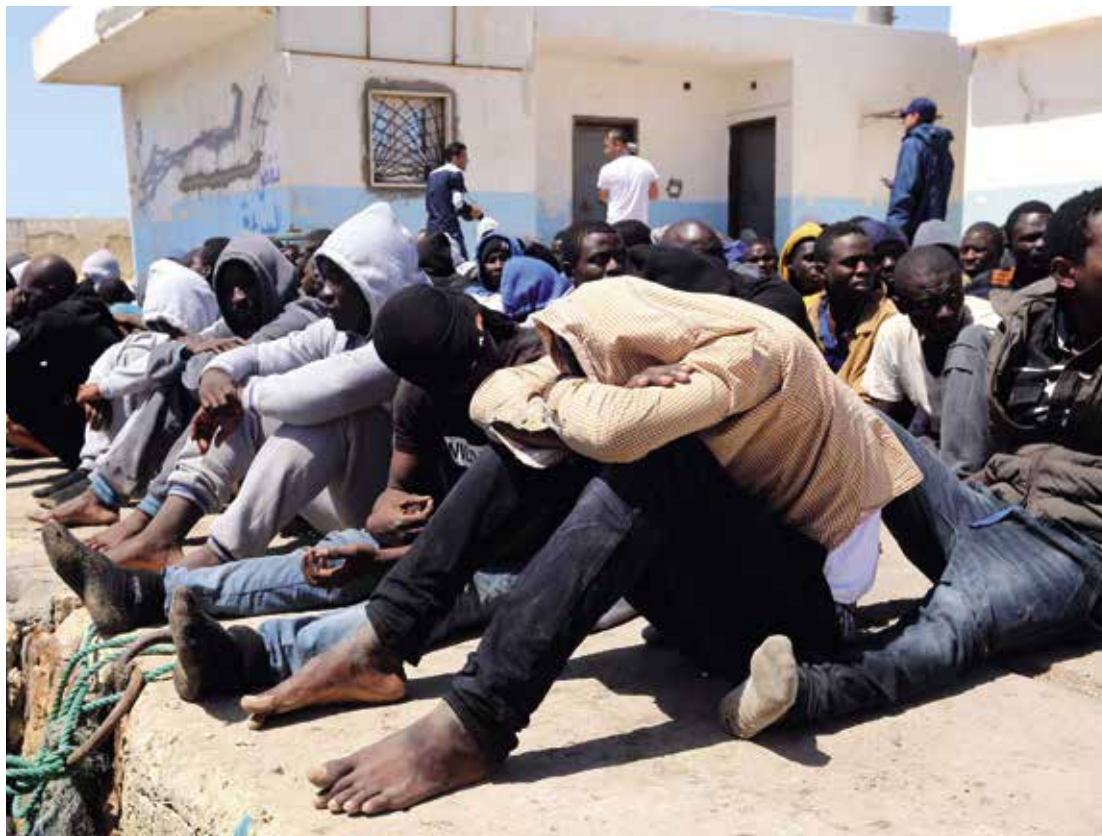
Migrants en situation irrégulière dans le port de Tripoli en Libye, après le secours de 117 migrants d'origine africaine par deux bateaux de gardécôtes au large de la Libye.

L'action visant à stabiliser les pays et régions fragiles et à assurer un développement économique et politique favorable et durable est étroitement liée à la gestion des flux de migration à venir. L'objectif 1 (pas de pauvreté), l'objectif 8 (travail décent et croissance économique) et l'objectif 16 (paix, justice et institutions efficaces) notamment sont essentiels pour la gestion de la migration et la responsabilisation des États quant à la réintégration de leurs ressortissants, visée par l'Agenda 2030.