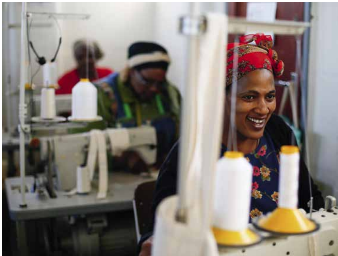
Couturière travaillant dans la coopérative "Singalaka" qui offre des perspectives économiques durables pour les hommes et les femmes dans les townships sud-africains.