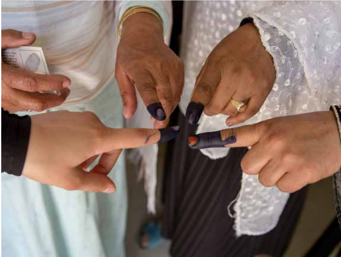
Femmes afghanes ayant voté au second tour des élections présidentielles en Afghanistan en 2014.

Le Danemark entend fermement défendre les droits de l'homme, la démocratie et l'égalité entre les sexes à l'échelle mondiale. Nous entendons promouvoir ces valeurs dans une série de contextes, de nos contacts avec les entreprises privées à une participation active aux négociations des Nations Unies en la matière. Les droits de l'homme, la démocratie, la bonne gouvernance, les principes de l'État de droit et l'égalité entre les sexes sont un domaine prioritaire indépendant de la coopération danoise au développement. Ils sont indispensables à la réalisation des objectifs de développement durable et font partie intégrante de ces derniers, et notamment de l'objectif 5 (égalité entre les sexes) et de l'objectif 16 (paix, justice et institutions efficaces) ainsi que de l'objectif 1 (pas de pauvreté) qui fait mention du droit à la propriété foncière et privée. Le Danemark entend soutenir le droit des démocraties à être des démocraties, y compris à être des partenaires égaux au sein des organisations multilatérales. À cet égard, le programme de voisinage, qui est axé sur les démocraties fragiles de l'Ukraine et de la Géorgie, constitue une initiative importante.