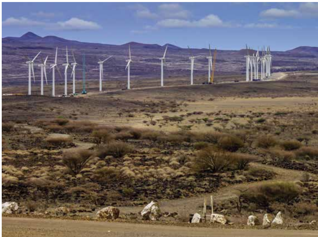
Le plus grand parc éolien d'Afrique, celui du lac Turkana au Kenya, avec une forte empreinte danoise. Vestas fournira 365 éoliennes, tandis que le Fonds danois d'investissement pour le climat et l'Agence danoise de crédit à l'exportation contribuent au financement.

Il est dans notre intérêt à tous que nous assurions une croissance mondiale durable. Une telle croissance est indispensable si nous voulons éradiquer la pauvreté et créer de l'emploi, notamment pour les jeunes. Chaque individu doit avoir la possibilité et la liberté d'exploiter lui-même son potentiel et d'assumer son avenir ainsi que celui de sa famille. Le moyen idéal d'assurer une croissance économique durable est de soutenir les initiatives privées dans une économie de marché bien réglementée qui renforce en même temps le libre-échange à l'échelle mondiale.